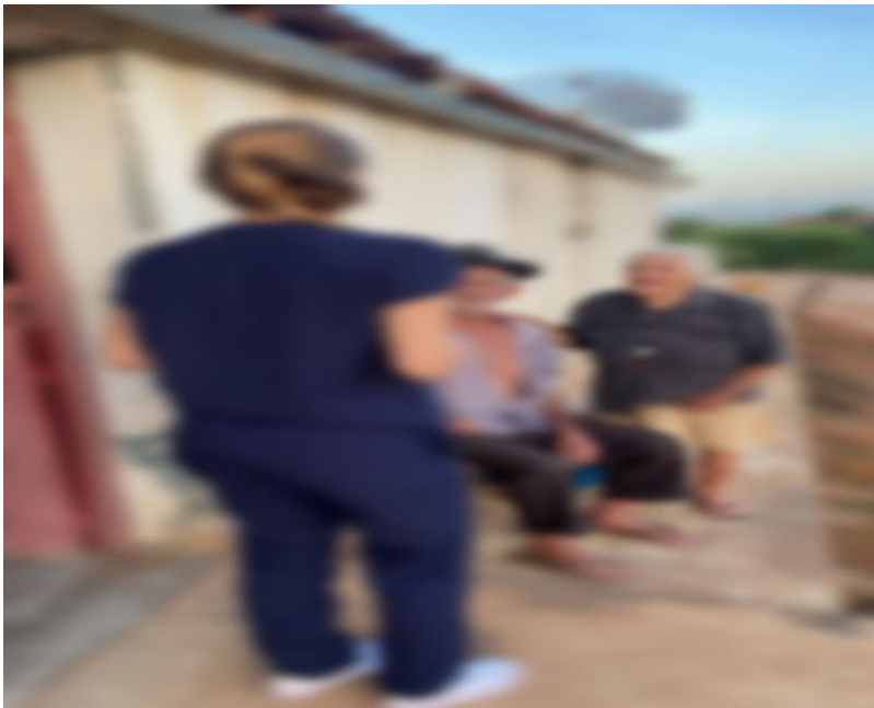
Figura 2: imagens de nossas ações com o corpo/rosto dos entrevistados borrados, para fins de preservar a privacidade de nossos assistidos.

Os resultados foram os mais satisfatório o possível, pois tudo o que foi repassado foi aprendido e certamente será colocado em prática assim que possível.